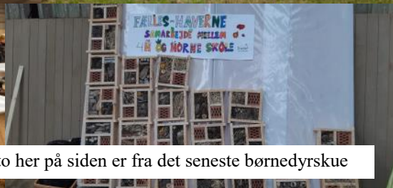
Foto her på siden er fra det seneste børnedyrskue